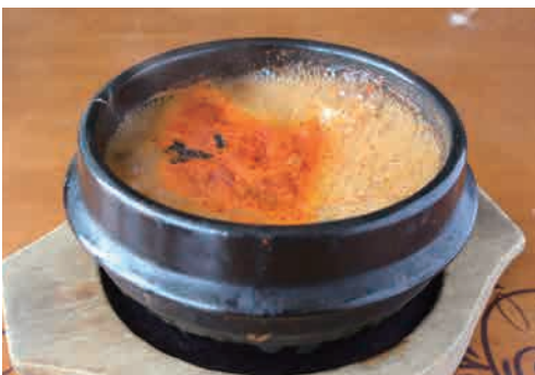
温玉ビビンバ弁当 ..... 790円